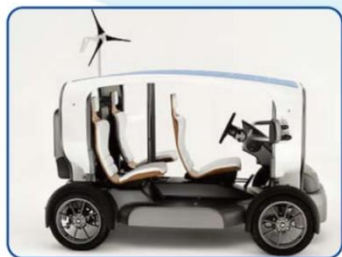
Figure 2-14. The Venturi Eclectic.