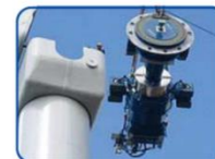
Figure 3-11. Typical components of a wind turbine (the gearbox, rotor shaft and brake assembly).