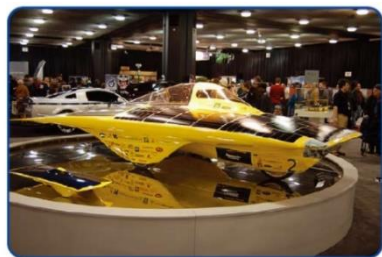
Figure 2-15. A Solar Powered Car at the Detroit Auto Show.